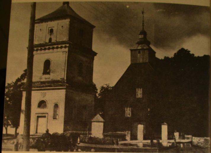
Senoji bažnyčia ir varpinė

vėjas pakildavo, bažnyčia tikrai imdavo braškėti, ir žmonės išsigandę bėgdavo iš jos laukan.