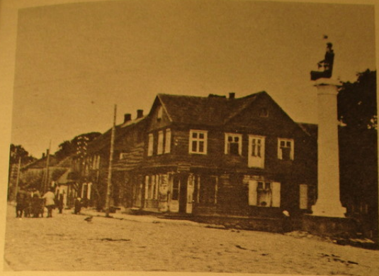
Pas Šv. Florijoną

mingiausia, net ir atlaidus prašokanti, yra Tautos šventė rugsėjo 8-tą. Jau ir bažnyčioje kitaip tą dieną yra, nes ateina į ją išsirikiavę šauliai. Šautuvus šventoriuje palieka, dailiai po tris į eilę sustatę, o patys su karišku žingsniu į bažnyčią sueina. Bet bažnyčioje, nors ir rikiuotėje būdami, kepures nusiima, ir klaupiasi kai klauptis reikia. O prie šautuvų šventoriuje vienas sargybinis paliktas yra.