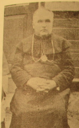
Prelatas Povilas Pukys

luomą. Kadangi šviesaus charakterio buvo ir labai pareigingas, geras buvo kunigas, tačiau gal dar geresnis administratorius ir bažnyčių statytojas.