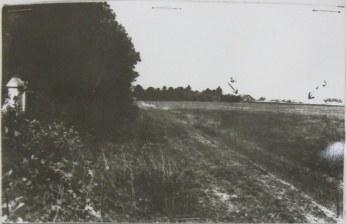
Общий вид местности на месте расстрела. Стрелками указаны: 1. Каменный забор еврейского кладбища. 2. Кутур в котором проживает свидетель Янушас. 3. Местеко Грузджий.

к протоколу осмотра места происшествия от 13 августа 1969 года.