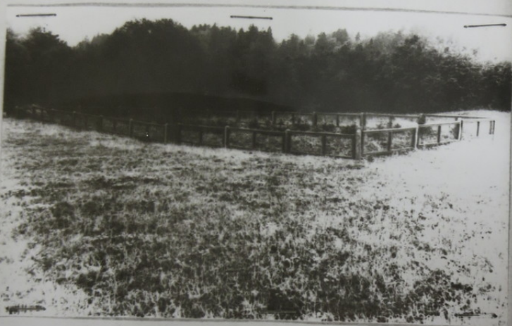
Общий вид места расстрела возле бывшего государственного хозяйства в Бубяй.

к протоколу осмотра места происшествия от 14 августа 1969 года.