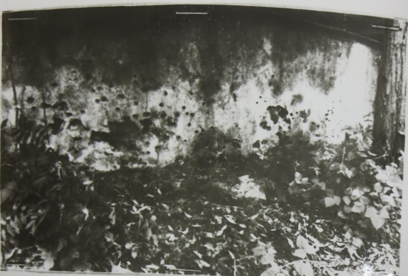
Следы на стене забора Грузджайского еврейского кладбища напротив насыпи.

Таблицу оформил: Следователь следотдела КГБ при Совете Министров Литов- ской ССР ст. лейтенант - Станислав ( Станисловайтис )