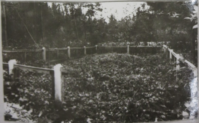
Место расстрела еврейского населения воле Грузджийского еврейского кладбища.