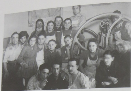
12, 13. VŽM

Macų kepyklos darbininkų grupinės nuotraukos. Šiauliai, 1940 m. kovo 2 d. M. Tjdmans nuotr.