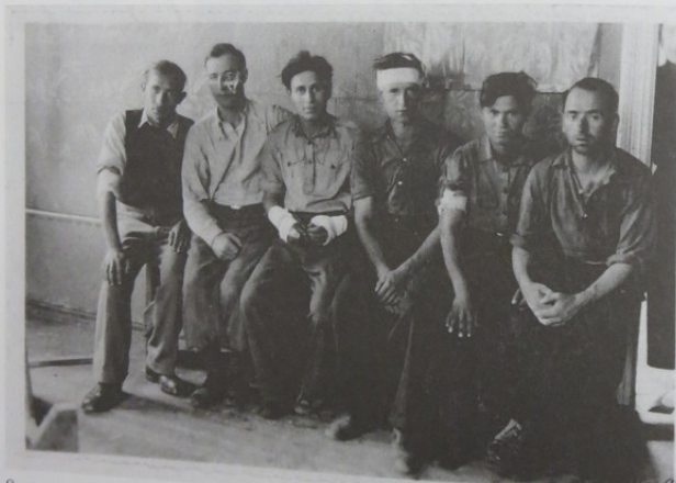
„Herclijos“ organizacijos sekretoriai. 1934 m. birželio 15 d. Секретариат организации «Герцлия». 15 июня 1934 г. The Board of the “Hertzliah” organization. June 15, 1934.