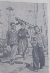
BAKU. 7-oje „Stainneit“ versloje 4-os Pavlo Korčagin vardo brigados natinkinai stovi darbo sąrgyboje Didžiojo Spailo garbei. Brigados sąrgyboje jau 200 tūnų viršplėninės naties. Dabar jaunimo brigada paruošė užduotį įvykdyti 104 ir daugiau procentų.