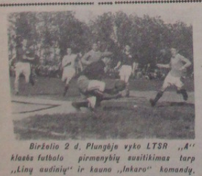
Birželio 2 d. Plungėje vyko LTSR „A“ klasės futbolo pirmenybių suviltimas tarp „Liny audinių“ ir „Ikaro“ komandų. Rezultatai 1:1.