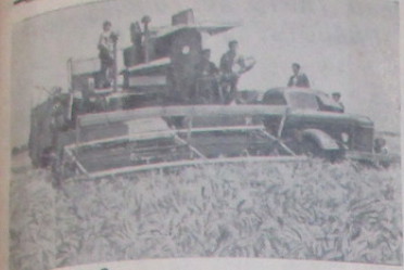
AZERBAIDŽANO TSK. Respublikos kolektyvams pradedant atlikti darbus... NUOTRAUKIOS: Krasnojarsko MTS mechanozavodui kolektyvams...