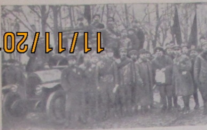
RAUDONOJI GVARDIJA 1917 METAIS