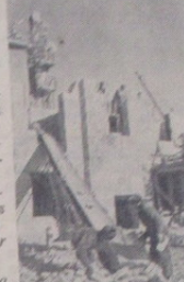
KARA-KALPAKJOS ATSR. Še- tolyje pūkmedio gale pradėsi veisti Tachia-Talo šiluminė elektrinė. Nuotrauka kije stotiesme aknuojai kambaryj gyvenamasis namais Tachia-Talo SES statyboje.

Piniginis avansas kolokietiams taip pat išmokamas „Lėpsnos“ „Komunizmo rlyto“ ir „Raudonosios vėlavos“ kolokiuose. (ELTA).