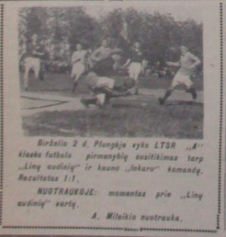
Birželio 2 d. Plungėje vyko LTSR „A“ klasės futbolo pirmenybių susitikimas tarp „Liny audinių“ ir „Lokaro“ komandų.