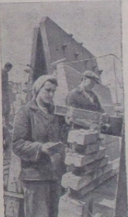
TAŠKENTO SAITAS. 114 kilometru nuo Taškento osančiamis anglies bazine statoma stambiausia Vidurinėje Azijoje Angrensko HRES.

1940 metais laudais galų gale nusikratė buržuazinės fašistinės diktatūros ir paėmė vaidiųjų savo rankas.