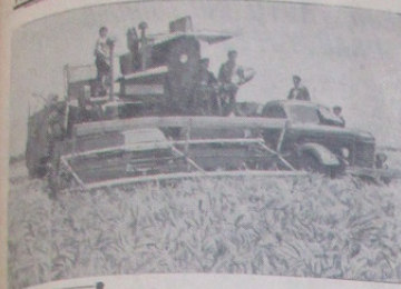
AZERBAIDŽANO TŠR Respublikos kolūkiuose prasidėjo rankinis grūdinių kultūrų derliaus nuėmimas. Pūktai, dirba Krasnoslavo MTS mechaniatoriai Saailas-ko rajono Lenino mėslo kolūko laukuose. Nuėmimo Lentos var-je apimama 12-15 hektarų plotą per dieną priekolia po 20 centnerius grūdį iš kiekvieno ha.