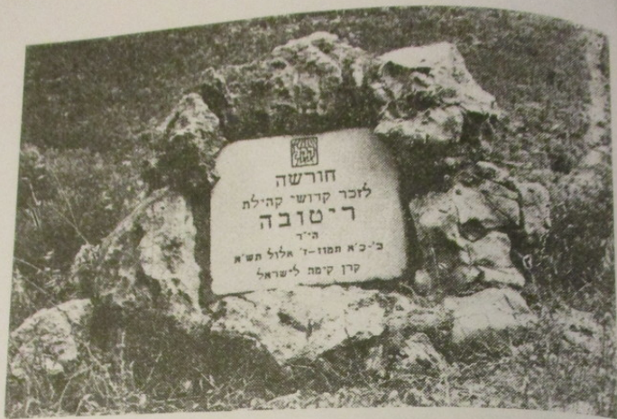
Memorialinė lenta Šventajame miške Rietavo kankiniams atminti atidengta 1970 m. Žmonės, stovintys šalia, padeda suvokti lentos dydį