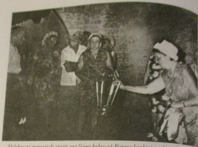
Holokausto memorialo rūsyje ant Siono kalno už Rietavo kankinių sielas 1965 metais Atminimo dieną uždegama žvakė

žydų iš Kauno ir Šiaulių getų buvo išvežti į darbo stovyklas. Getai buvo paverti koncentracijos stovyklomis. Vaikai ir suaugę, pripažinti netinkamais darbui, buvo išsiųsti į mirties stovyklas Lenkijoje.