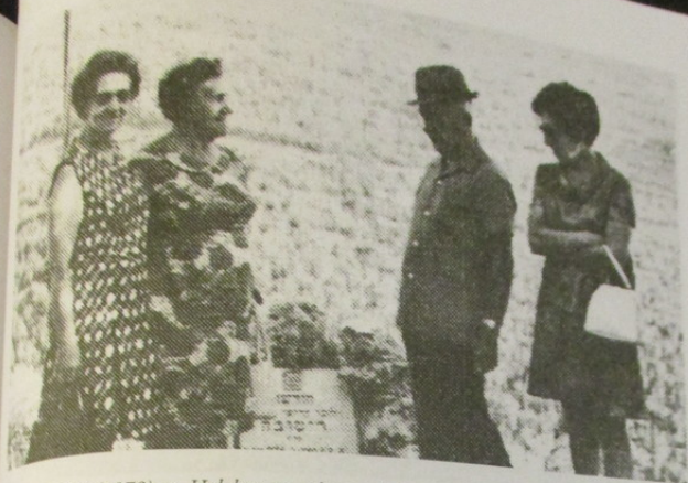
Elulo 5730 (1970) m. Holokausto aukų atminimui pasodintame Šventajame miške Atminimo dieną atidengiama dar viena memorialinė lenta. Apačioje ta pačia proga susirinkę Izraelio rietaviškiai