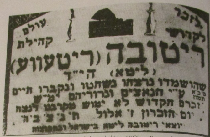
Lentelė Rietavo kankiniams Siono kalne pakabinta 1965 m. Pastatas lentelės centre yra senosios sinagogos Rietave reprodukcija

da mums veikti prieš žydus. Kartais jie net imasi veiksmų savarankiškai,“ – rašė savo raporte Stahleckeris.