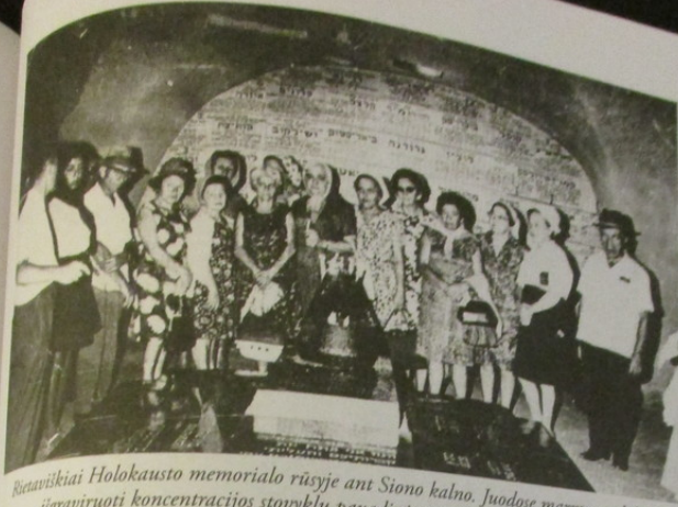
Biearviškiai Holokausto memorialo rūsyje ant Siono kalno. Juodose marmuro plokštėse išgraviruoti koncentracijos stovyklų pavadinimai.

Tyla visiško sunaikinimo procese vyravo iki 1943 metų vasaros. Vis dėlto šiuo periodu pavieniai žydai ir jų grupės getuose buvo žudomi. Daugiausia taip jie buvo baudžiami už nežymius prasižengimus, pavyzdžiui, maisto gabenimą į getą kontrabandiniu būdu ar atsisakymą segėti geltoną žvaigždę. 1943 metų vasarį 45 žydai buvo nužudyti Kaune už nedidelį nusizengimą. Taip įpykę vokiečiai atkėsijo už Vermachto pralaimėjimą Stalingrade. 1943 metų kovą ir balandį rytų Lietuvoje buvo likviduotos kelios mažos darbo stovyklos ir getai. Per vieną dieną, balandžio 5-ąją, vokiečiai nužudė apie 4 000 žydų Paneriuose šalia Vilniaus. Apie „operacijas“ buvo nedelsiant raportuota RSHA Berlyne. Buvo pranešta, kad „... Baltarusiškos teritorijos, prijungtos prie Lietuvos, ... buvo išvalytos nuo žydų... Maždaug 4 000 pripažintų netinkamai darbui praėjo specialią procedūrą...“