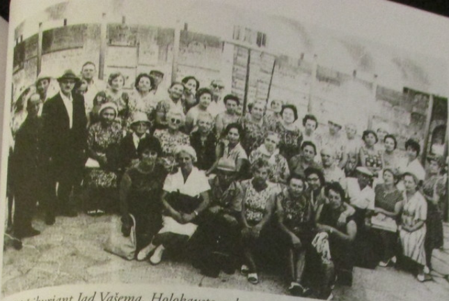
Prieš įkuriant Jad Vašemą, Holokausto aukų atminimui ant Siono kalno Jeruzalėje buvo atidaryta atminimo aikštelė, matoma nuotraukos fone. Izraelitai ir kiti, kurių kankinys Rietave, prie kolonados lentelės Rietavo kankiniams atidengimo 1965 m. proga. Svarbiausia šios aikštelės vieta yra šalia esančio pastato rūsyje, knygos originale vadinama Holokausto rūsiu ant Siono kalno Jeruzalėje

Lietuvos žydų naikinimas prasidėjo vokiečių invazijos dieną. Visoje šalyje atskandinti žydų nužudė lietuviai. Daugeliu atvejų pogromai buvo organizuojami iš karto po Raudonosios armijos atsitraukimo, dar prieš įžengiant Vermachtnui. Po karo paskelbti dokumentai rodo, kad pirmieji nurodymai persekioti žydus Lietuvos nacionalistus pasiekė dar prieš prasidedant Vokietijos ir Sovietų Sąjungos karui. Direktyvas savo slaptoms organizacijoms Lietuvoje siuntė Lietuvos aktyvistų fronto (LAF) Berlyne nariai.